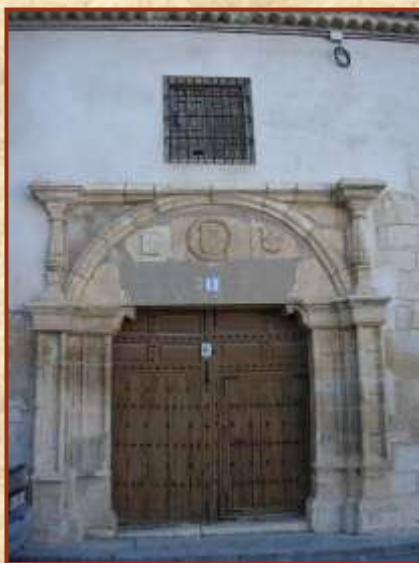
Palacio de los Comendadores

Flanqueando la plaza encontramos las casas-palacio señoriales de las “ Buhardillas ” y de la Encomienda .