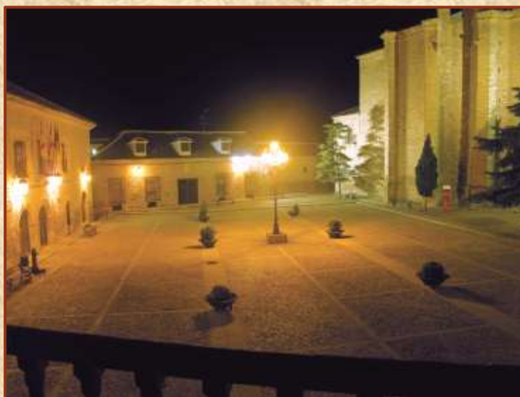
Iluminación del entorno de la Plaza de la Villa

En este entorno podemos encontrar monumentos de interés cultural como, la Iglesia de Nuestra Señora de la Asunción , que data de los siglos XV y XVII y el Edificio del Ayuntamiento , ambos renacentistas