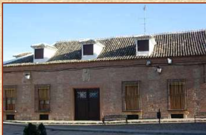
Casa de las “Buhardillas”

Palacio de los Comendadores , edificio del siglo XVI de planta rectangular, con extenso patio, que fue residencia de los comendadores de la Orden de Santiago, coronan el portón dos escudos con la Cruz de Santiago dentro de un arco que se aloja en un amplio dintel. También llamada Casa de la Encomienda .