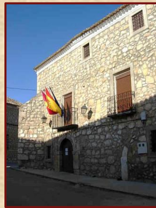
Edificio de la Tercia. Entrada a las oficinas y caras norte y sur del edificio