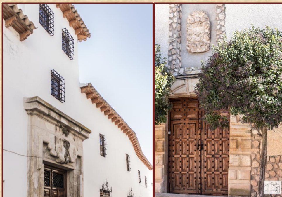
Fachadas de casas señoriales

Esta vía es un ejemplo de arquitectura típica de la Edad Media, está compuesta por numerosos palacetes y casonas de piedra, en su mayoría, con una arquitectura de mampostería y sillería.