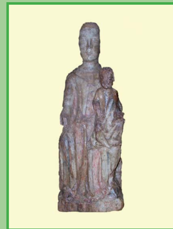
Talla Románica de la Virgen de Magaceda S.XIII